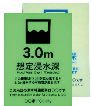
河川のはん濫時に浸水する高さを想定した看板