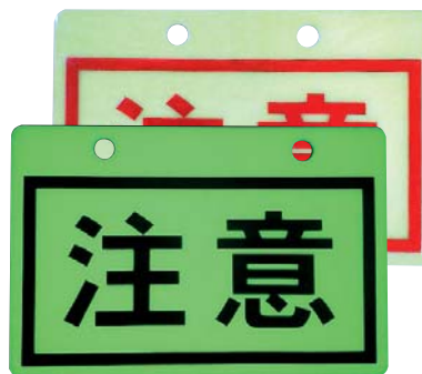
注意を呼びかけたい場所に設置する看板