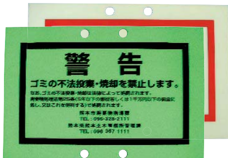
ゴミの不法投棄・焼却を禁止する看板