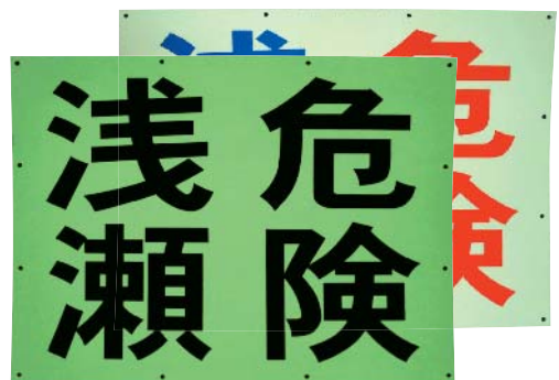
漁港内の浅瀬を知らせる看板